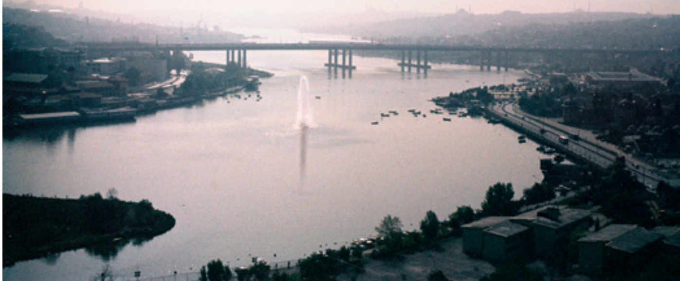
Die Türkei als Demokratie mit islamischer Religion könnte als EU-Mitglied zum Vorbild werden: Brücke über den Bosphorus.

D as Europa, in dem ich aufwuchs, endete in Berlin am Checkpoint Charlie. Als ich ihn zum ersten Mal passierte, im Orwell-Jahr 1984, fand ich mich in einer fremden Welt. Ein Junge fragte, ob ich Toffifee kenne. Es war, wie er mir erklärte, ein Praliné, und er konnte es kaum fassen, dass ich mein Privileg als Westler, sie zu essen, nicht nutzte.